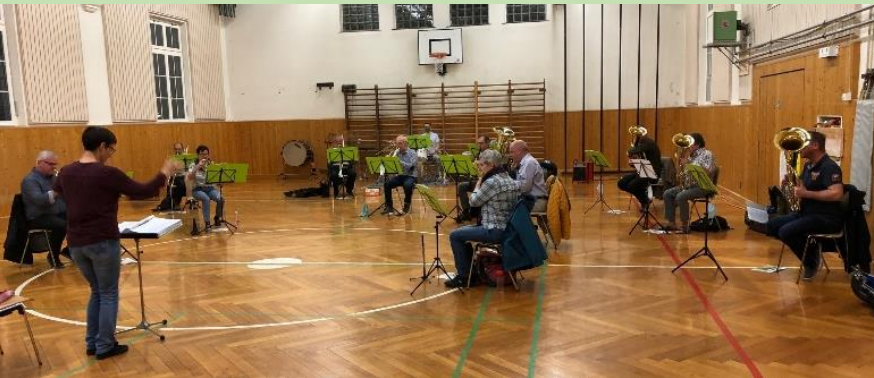
Während Corona werden die Proben in die alte Turnhalle verlegt, wo die Abstände problemlos eingehalten werden können.

Damit die Blaskapelle Thurgados nächstes Jahr auch musikalisch bereits ist, probt sie zurzeit mit grossen Abständen und der maximal erlaubten Anzahl Musikanten. Notfalls kann die Blaskapelle aufgeteilt werden, so