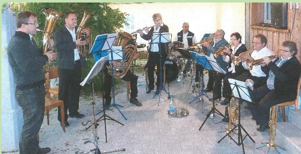
Die Blaskapelle Thurgados an ihrem ersten Auftritt am Gärfestival in Steinebrunn am 18. September 2011

Mit weiteren gleichgesinnten Musikkollegen sollte im kleinen Kreis die böhmisch-mährische Blasmusik gepflegt werden.