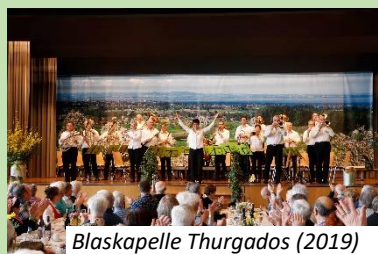
Blaskapelle Thurgados (2019)