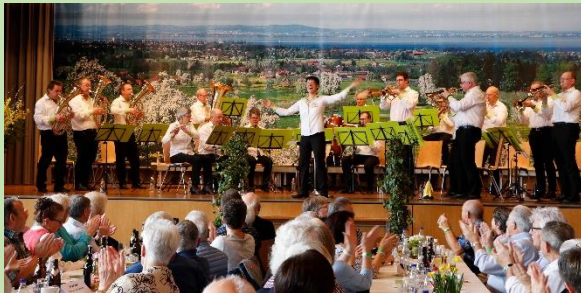
So hätten wir auch gerne am Oberthurgauer Blaskapellen-Sonntag 2020 aufgespielt.

Aus all diesen Gründen mussten wir schlussendlich auf eine Verschiebung verzichten und hoffen auf Eurer Verständnis. Wir freuen uns, für Euch bei anderer Gelegenheit wieder aufspielen zu können.