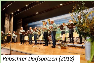
Räbschter Dorfspatzen (2018)