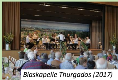
Blaskapelle Thurgados (2017)