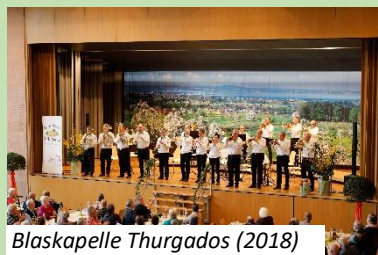
Blaskapelle Thurgados (2018)