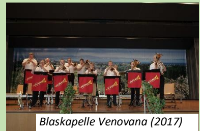
Blaskapelle Venovana (2017)