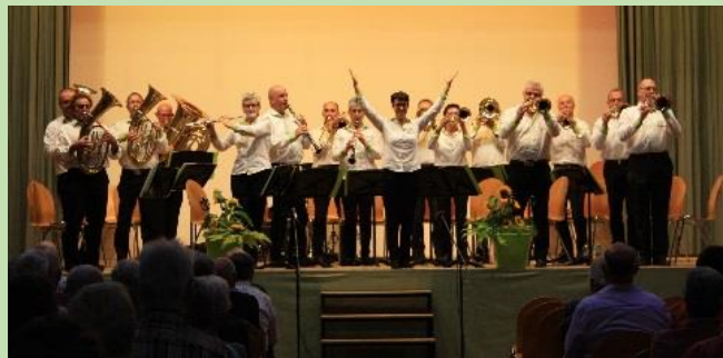
Kein Wettspiel im Jahr 2020: Die Blaskapelle Thurgados am Schweizer Blaskapellen-Treffen in Weggis (2018)

Doch auch viele anderen Auftritte der Blaskapelle Thurgados mussten abgesagt oder verschoben werden. Im ersten Halbjahr konnten wir fünf geplante Auftritte nicht bestreiten. Ebenso findet dieses Jahr kein Schweiz. Blaskapellen-Treffen statt. Der Anlass in Grosswangen wird nun im Jahr 2022 über die Bühne gehen. Dadurch verschiebt sich auch das Schweiz. Blaskapellen-Treffen in Weinfelden um zwei Jahre und wird nun 2024 stattfinden.