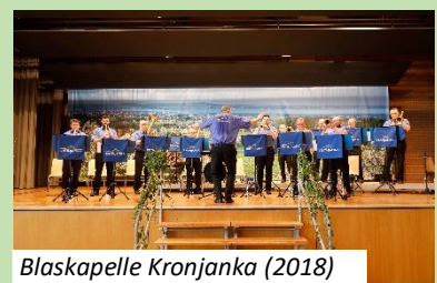
Blaskapelle Kronjanka (2018)