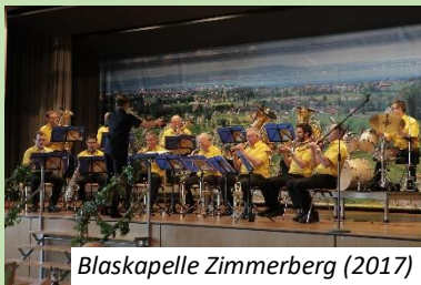
Blaskapelle Zimmerberg (2017)

Anstelle von Bildern des diesjährigen Blaskapellen-Sonntags können wir Euch nur ein paar Erinnerungen der bisherigen Durchführungen zeigen. Wir freuen uns auf's nächste Mal.