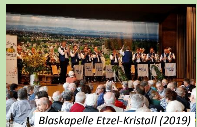
Blaskapelle Etzel-Kristall (2019)